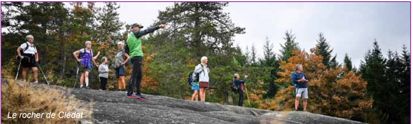
Le rocher de Clédât

Une semaine de nature commence ! Distance : 7 km - D+ : 350 m - 3 heures de marche