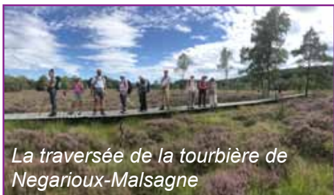
La traversée de la tourbière de Négarioux-Malsagne

Après un passage par la maison du PNR Millevaches en Limousin, nous irons aux sources de la Vienne.