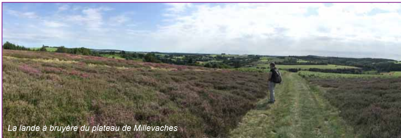
La lande à bruyère du plateau de Millevaches

Distance : 19 km - D+ : 450 m - 6h30 de marche